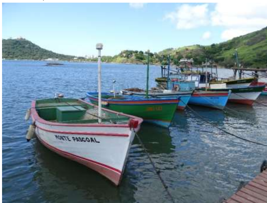
Figura 5 – Barco tipo boca aberta