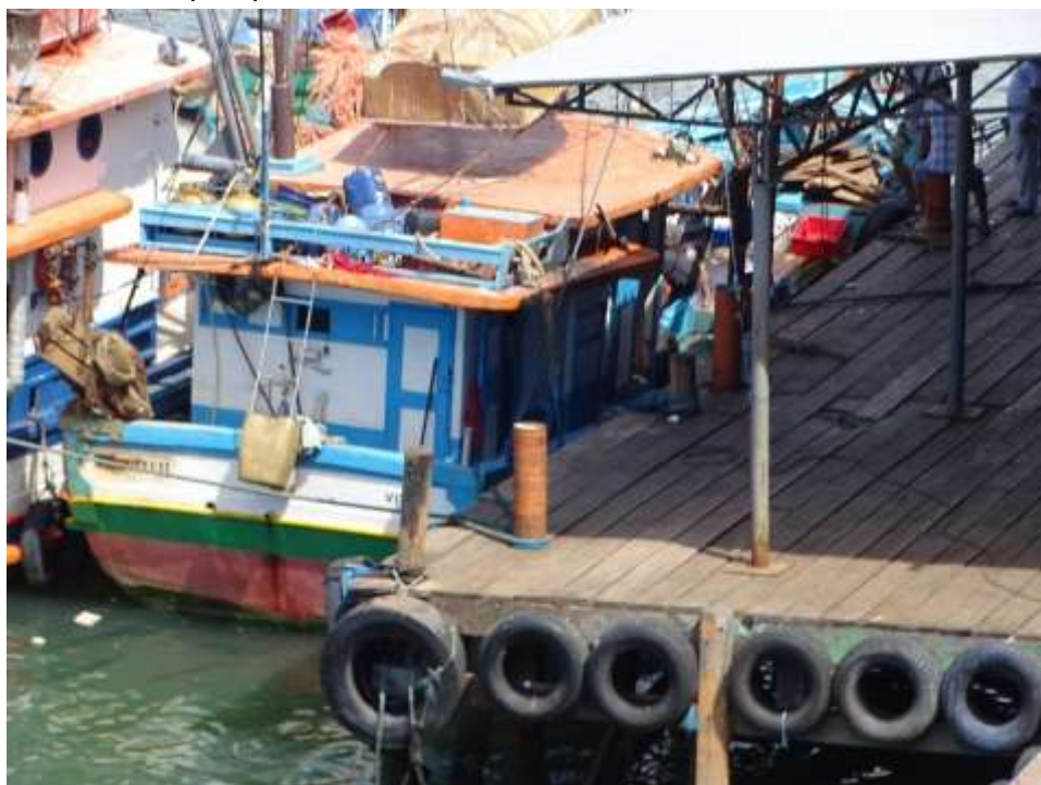
Figura 3: Terminal pesqueiro de Praia do Suá

As embarcações da comunidade de Praia do Suá ficam na margem esquerda da Baía de Vitória. Há um terminal de pesca - Figura 3 - com fábrica de gelo, estaleiro e área de manutenção - Figura 4 - e fabricação de petrechos de pesca. Observou-se que o local é bem amplo e possui até mesmo um salão utilizado para reuniões.