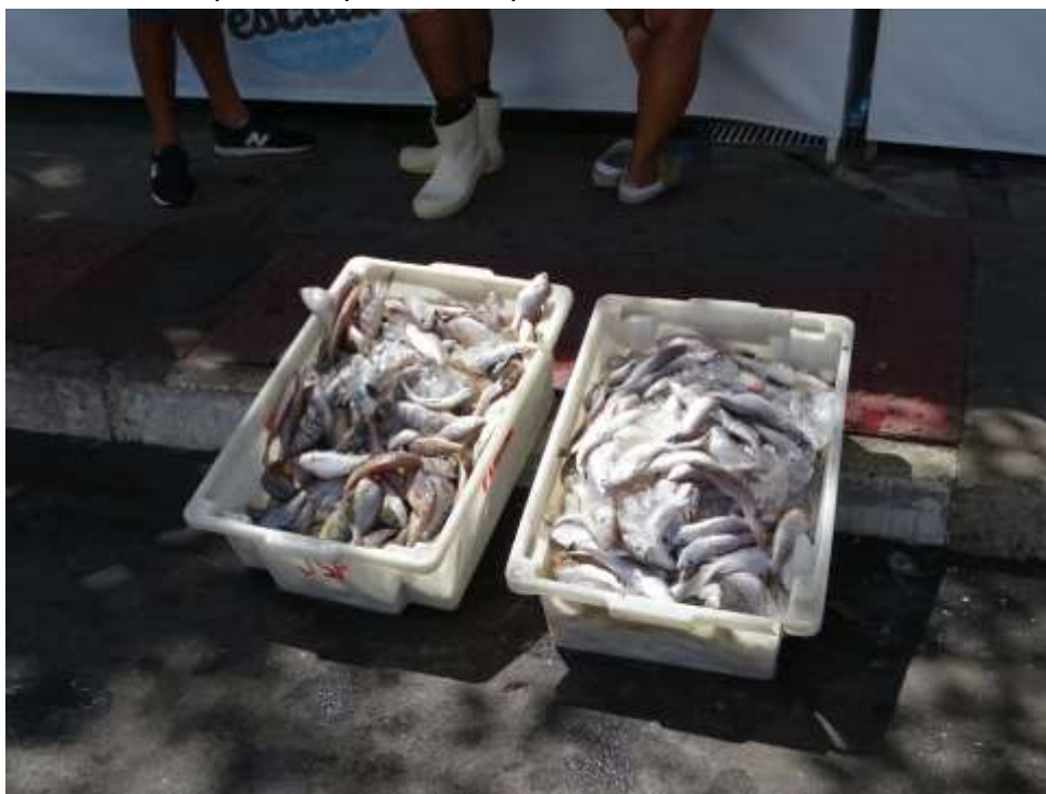
Figura 7 - Venda de pescado próxima ao píer

e na peixaria da Vila Rubim, no caso dos pescadores das embarcações maiores. Os pescadores destas últimas comercializam alguns pescados para atravessadores que comercializam no mercado externo – Figura 7. As principais espécies capturadas são: Cioba, badejo, catuá, garoupa, dentão, papa-terra, olho-de-boi, robalo, tainha, sargo, carapeba, lagosta e camarão.