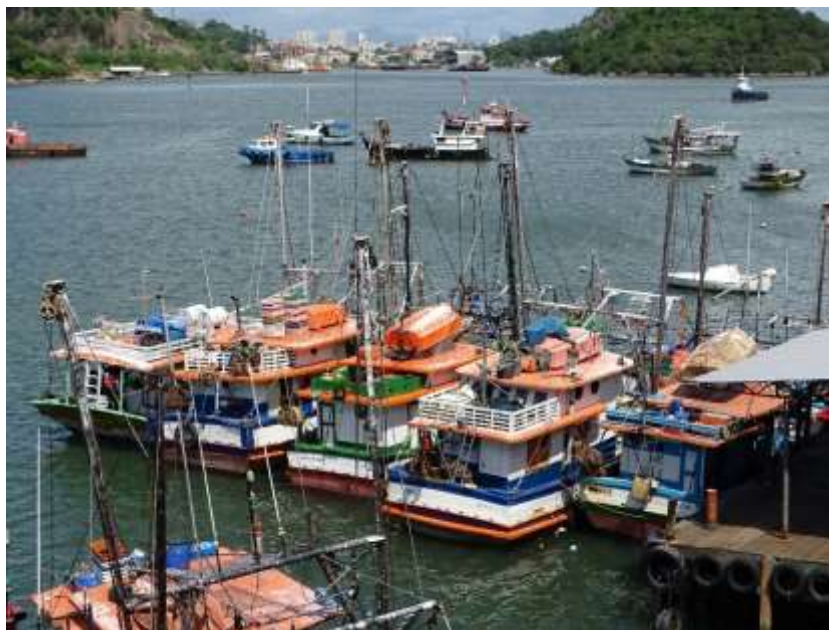
Figura 8 – Embarcações maiores com casaria e convés

do auxílio do citado equipamento, a navegação e a pesca são feitas com base na experiência do mestre. As bateiras usam motor de popa e comportam até dois tripulantes. A pesca desta embarcação é feita em regiões mais próximas, na Baía de Vitória.