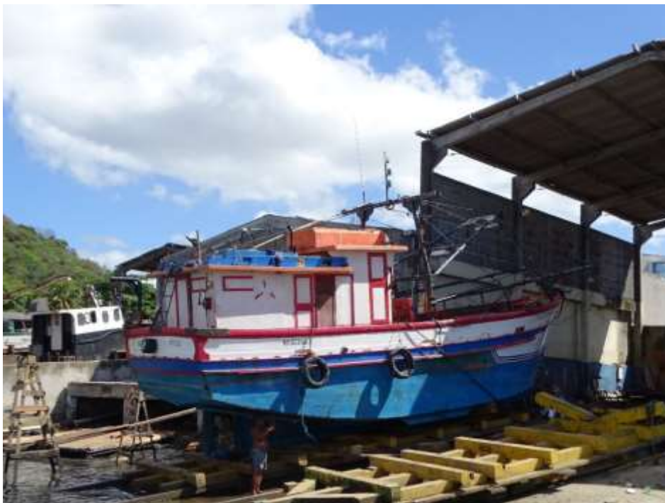
Figura 4 – Estaleiro do Terminal Pesqueiro