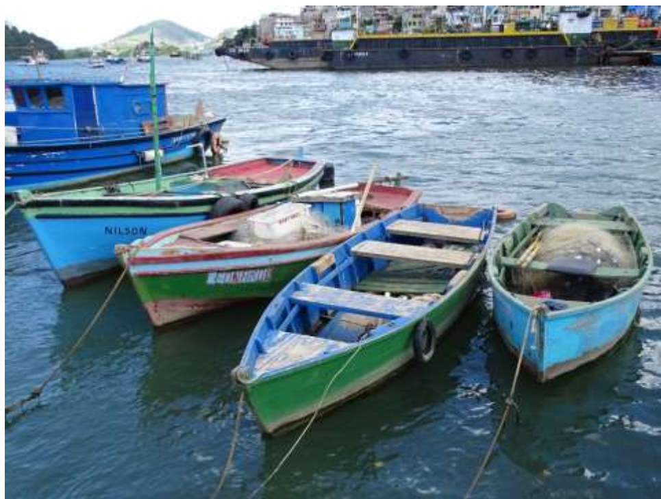
Figura 9 – Bateiras