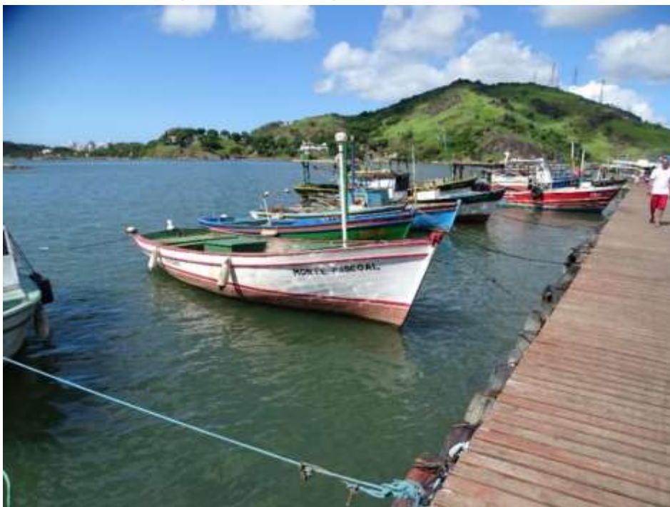
Figura 5 – Píer de embarque e desembarque